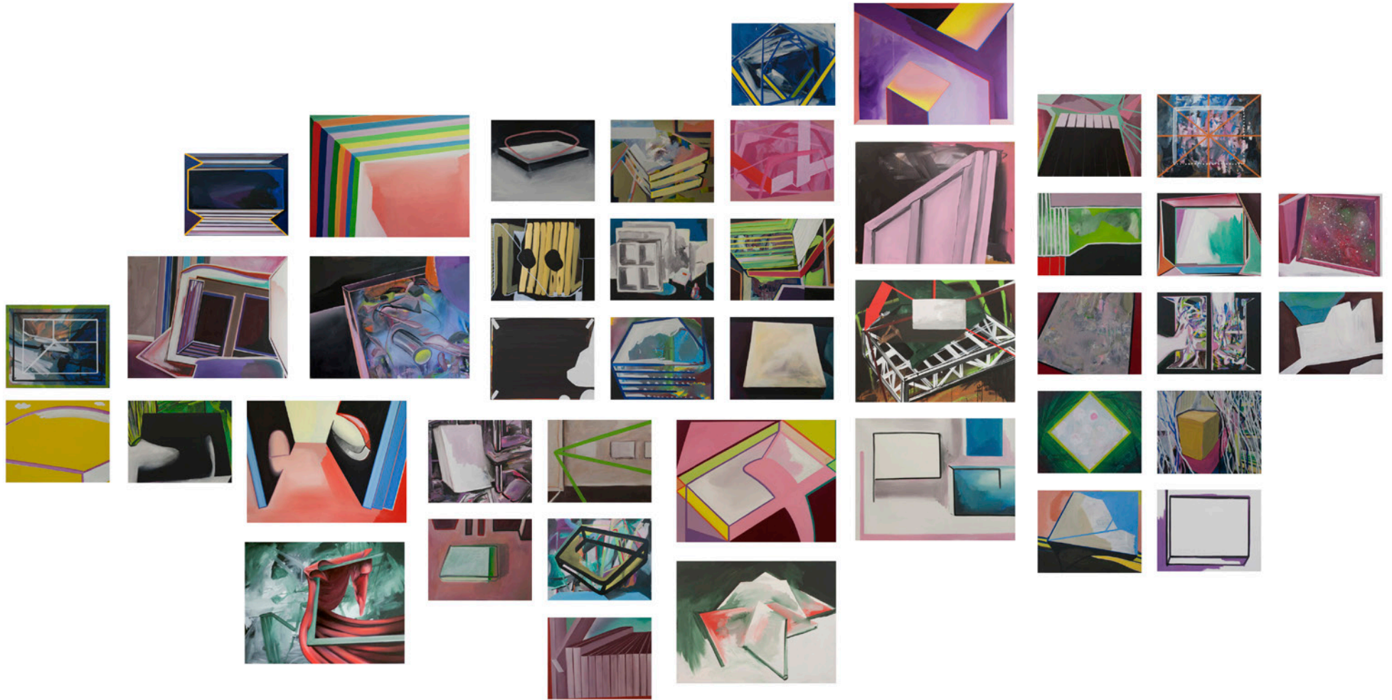
Overview Projekt «Leere Bilder»