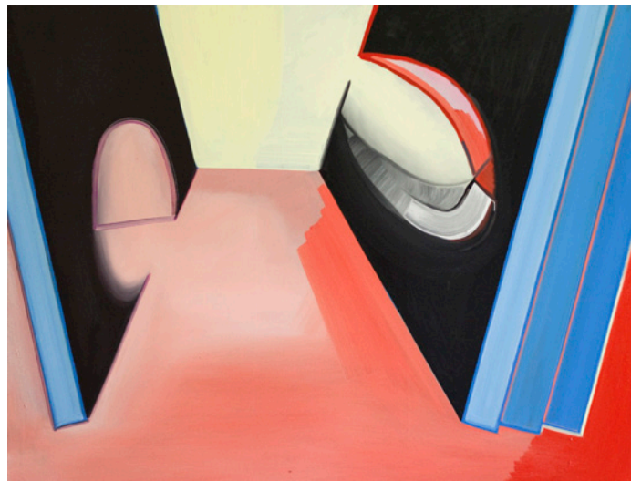
374 | Leere Bilder