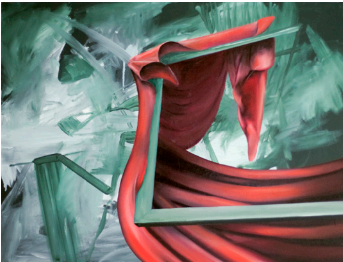
372 | Leere Bilder