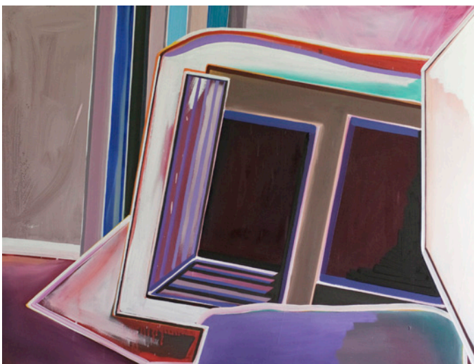
376 | Leere Bilder