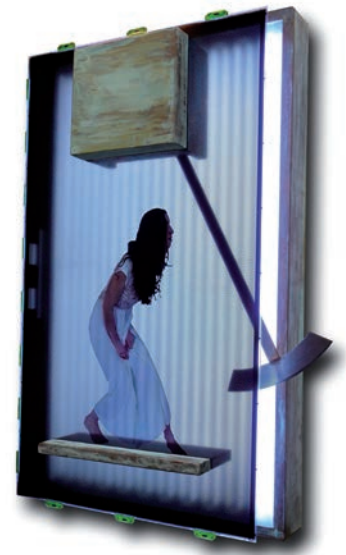
MARCK SIGHEL (2009)