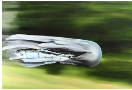
Thomas Riess WAAGRECHTSTARTER (2019)

Öl auf Leinwand 100 × 150 cm CHF 9'200.–