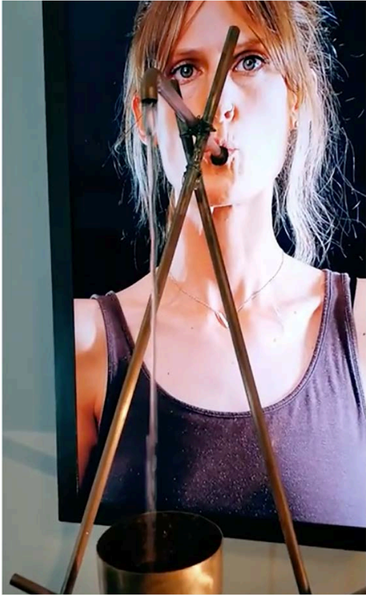
MARCK (CH) VIDEOSKULPTUREN