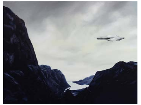
Thomas Riess OBSERVER (2019)

Öl auf Leinwand 100 × 150 cm CHF 9'200.–