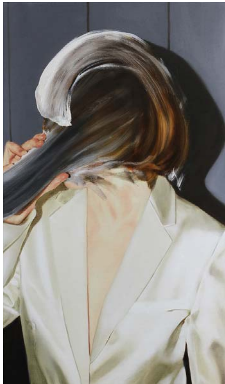
Thomas Riess VERÄNDERN (2020)

Öl auf Leinwand 150 × 110 cm CHF 9'650.-