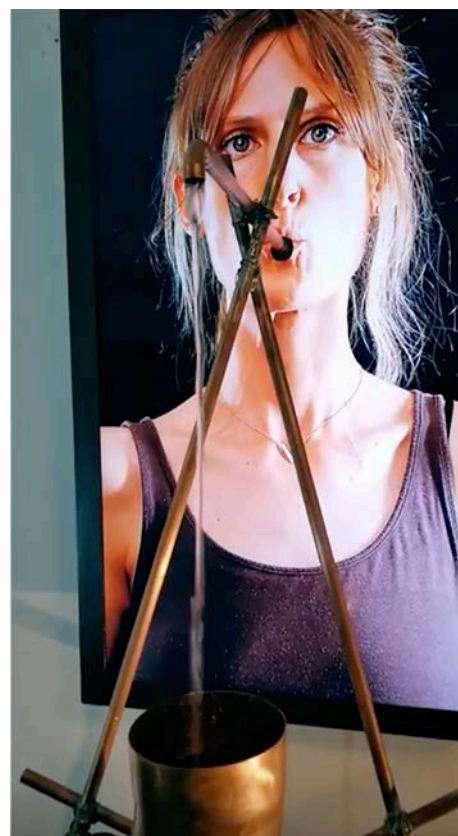
MARCK SPIT (2021)

LCD Screen, LED light, metal frame, plastic, Trombone, Water