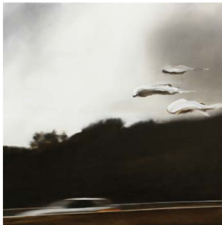
Thomas Riess FOLLOW (2019)