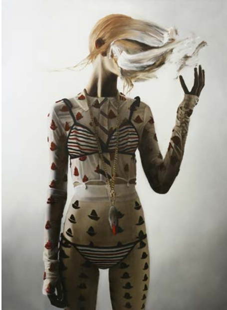
Thomas Riess TALISMAN (2021)

Öl auf Leinwand 150 × 110 cm CHF 9'650.-