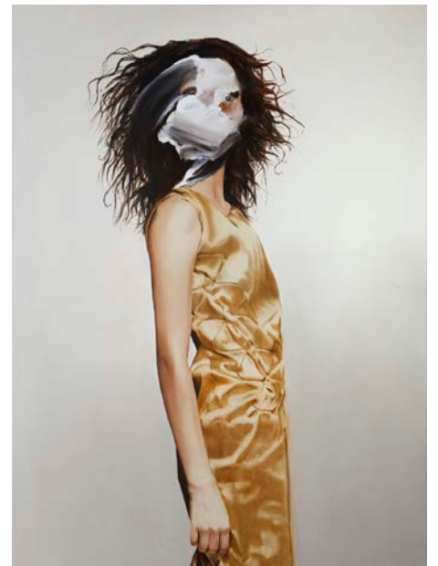
Thomas Riess DIVA (2020)

Öl auf Leinwand 150 × 110 cm CHF 9'650.-