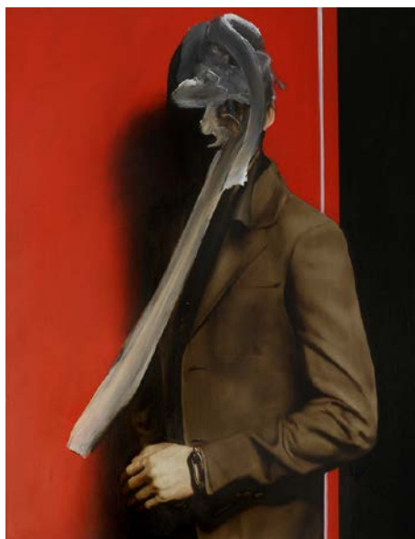
Thomas Riess KOMM! (2021)

Öl auf Leinwand 150 × 100 cm CHF 9'200.–