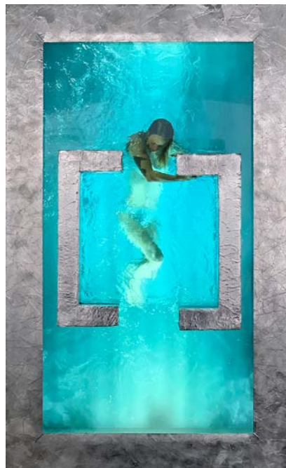
MARCK GEGENSTROM (2021)

LCD Screen, LED light, metal frame, plastic